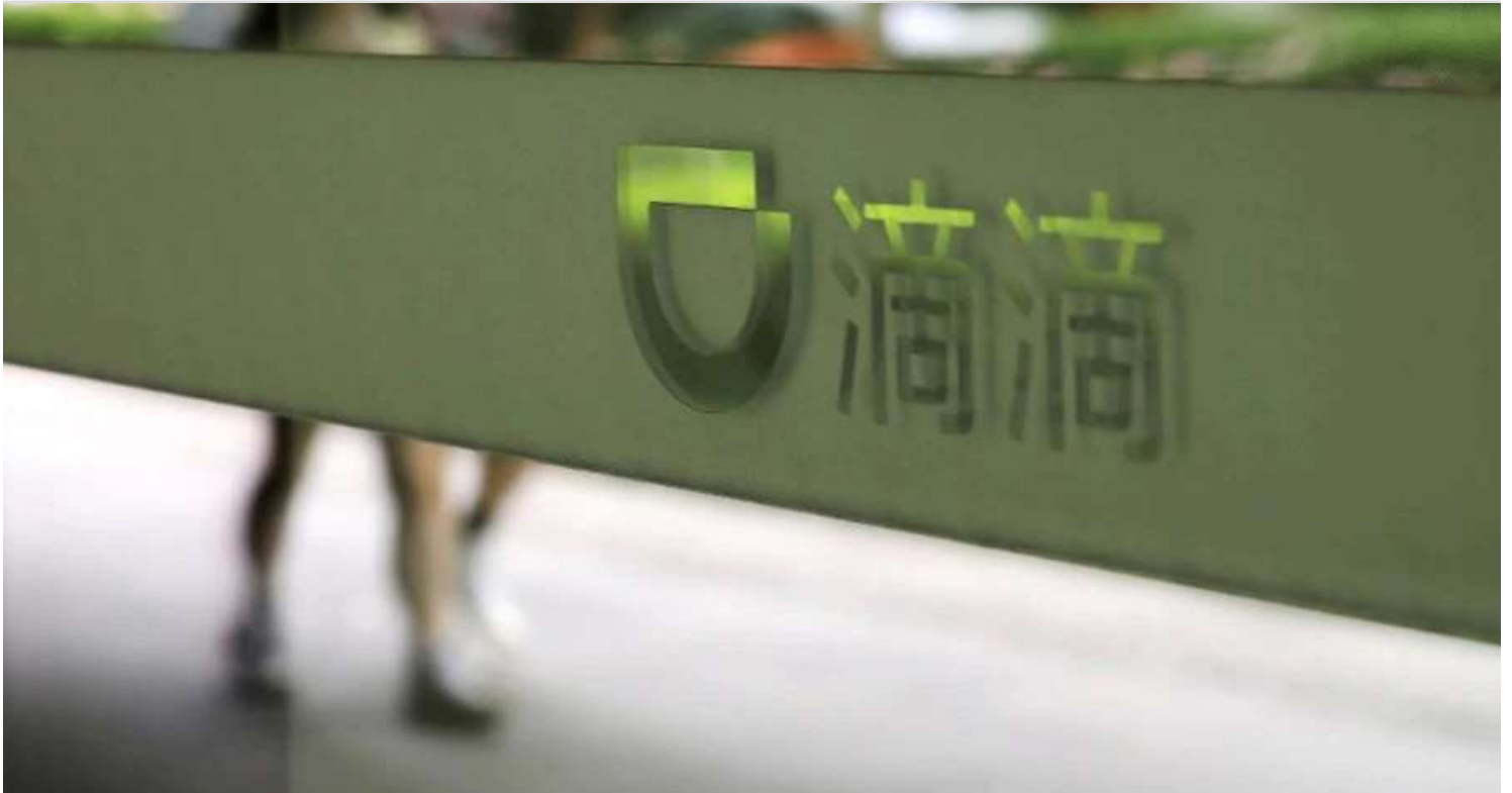
Un cartel de Didi en su sede en Pekín

El riesgo que plantea DiDi es sólo la punta del iceberg , ya que las empresas con sede en la RPC amplían su alcance en el espacio del comercio electrónico como parte de la “Ruta de la Seda Digital” de China. Aunque todavía son limitadas en América Latina y Occidente en comparación con actores establecidos como Amazon , las empresas con sede en la RPC, una vez subordinadas totalmente al Estado chino, proporcionan potencialmente al SMS de China acceso a los hábitos de gasto y a la situación financiera de innumerables personas de interés . Las plataformas Business-to-Business podrían utilizarse igualmente para obtener datos técnicos, información sobre ofertas de la competencia o vulnerabilidades, a medida que las empresas chinas continúan su expansión global. El despliegue de la RNB digital por parte de la RPC, a tiempo para acoger los Juegos Olímpicos de Invierno en febrero de 2022, ampliará aún más estos riesgos.