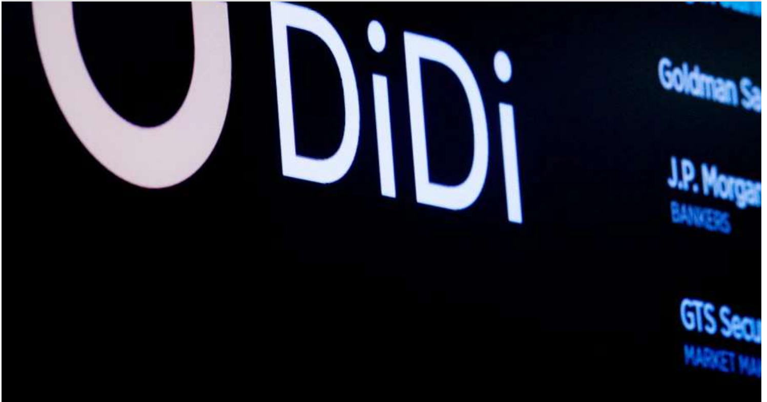
El logo de Didi

La creciente preocupación en el Reino Unido y en la Unión Europea por la vulnerabilidad de los datos de sus propios usuarios, puesta de manifiesto por el intento del gobierno chino de forzar a Didi, obligó a la empresa china de viajes compartidos a posponer importantes planes de expansión en Europa.