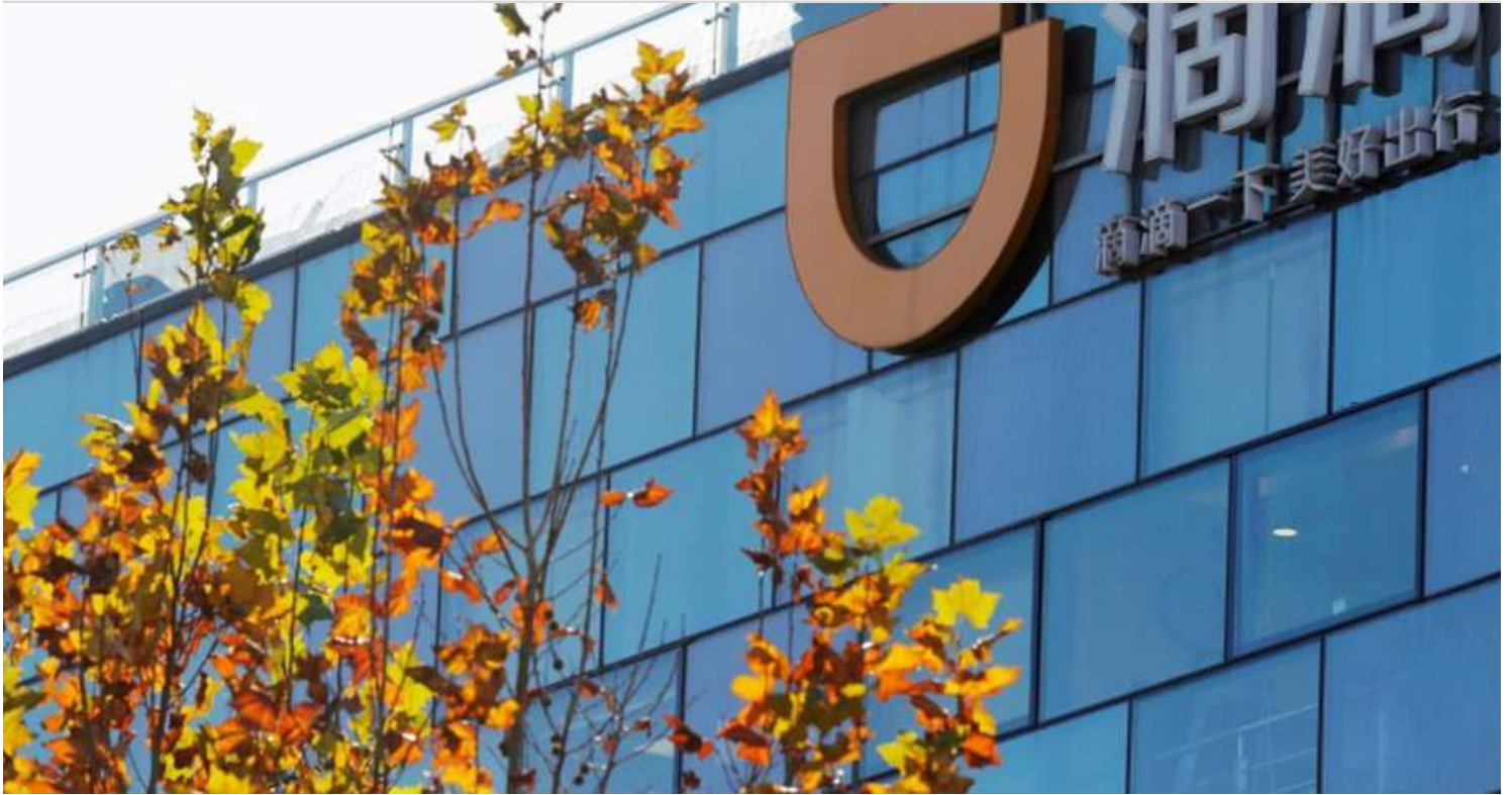
La oficina central de Didi

Tanto los funcionarios de la administración estadounidense como los líderes del Congreso han prestado mucha atención al riesgo de la participación de empresas chinas como Huawei en las arquitecturas de telecomunicaciones, especialmente a medida que el número de dispositivos y los datos asociados a los que se accede se multiplican con el despliegue de la 5G y el “Internet de las cosas” (IOT). Del mismo modo, se ha prestado cada vez más atención a los riesgos que plantea la difusión mundial de sistemas de vigilancia y tecnologías de “ciudades inteligentes” construidas por empresas chinas con componentes chinos. Tales sistemas permiten potencialmente a la inteligencia china acceder a datos sobre los movimientos, cuentas bancarias y de crédito, y otra información sensible sobre las élites gubernamentales y comerciales donde se despliegan esos sistemas. Esto incluye redes como la ECU-911 en Ecuador, la BOL-110 en Bolivia, la vigilancia fronteriza de Uruguay y la Zona Franca de Colón en Panamá, e incluso cámaras térmica